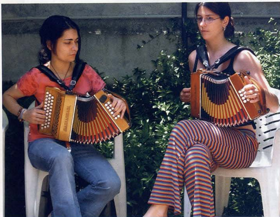
A les fotografies d'aquest article: estudiants del Departament de Música Tradicional de l'ESMUC

El 19 de gener de 2006 es va presentar a Reus el manifest fundacional de la Federació d'Escoles de Música i Instruments Tradicionals, que representa l'Escola Municipal de Música Tradicional de l'Arboç del