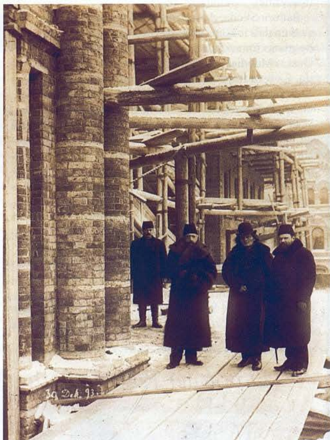
Anton Rubinstein, el 1890, mentre revisava les obres del Conservatori de Sant Petersburg, que va fundar el 1862

Espanya ha estat des de sempre un punt de referència atractiu per a la resta d'Europa, una imatge embolcallada en un difús halo de misteri, llegenda i color pintoresc, que els viatgers europeus van contribuir a difondre a través dels seus escrits posteriors. Aquesta visió va enterbolir una concepció més precisa de les diferents entitats que componien la península. En el cas dels pelegrins russos, això queda palès de manera unànime en els testimonis que es conserven. El viatge de Mikhaïl Glinka va servir, per exemple, d'inspiració i documentació no només per a la seva activitat creadora, sinó per a la resta de compositors que van rebre apunts de melodies, ritmes, així com consells sobre el que era o no era «espanyol». Igualment, cal destacar el llibre del metge Vassili Petróvitx Botkin, Pisma ob Ispanii (Cartes sobre Espanya) , publicat inicialment en francès el 1916, en el qual es descriuen les impressions coloristes produïdes pel viatge que el va dur des d'Irun fins a Cadis. Aquesta situació va provocar que, posteriorment, hispanòfils de la categoria de M. Druskin mantinguessin un eco de concepció generalista en els seus textos.