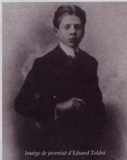
Imatge de joventut d'Eduard Toldrà

TOLDRÀ ES CULTIVÀ DES DE BEN JOVE AMB LES LECTURES DE MOLTS POETES.