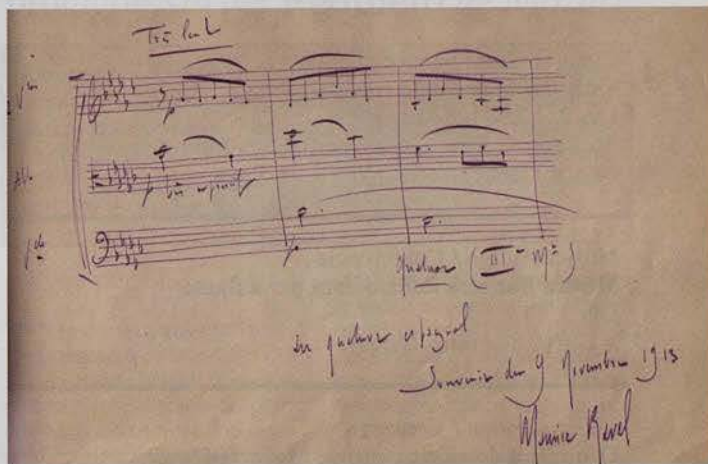
Manuscrits dedicats a Eduard Toldrà dels compositors Manuel de Falla i Maurice Ravel