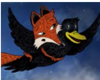
La rabosa i el corb quan van a la boda

7. Per parelles, prepareu per escrit un diàleg entre alguna d'aquestes parelles de personatges, tenint en compte que després l'haureu de representar davant el grup. Es tracta de fer créixer els diàlegs del llibre: