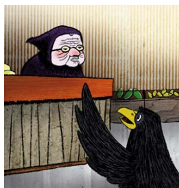
La rabosa i la botiguera