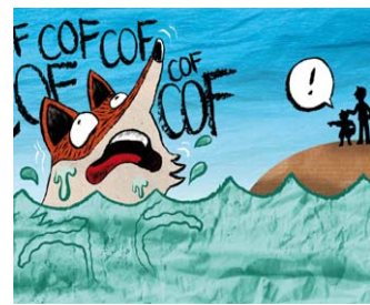
El pare i el fill