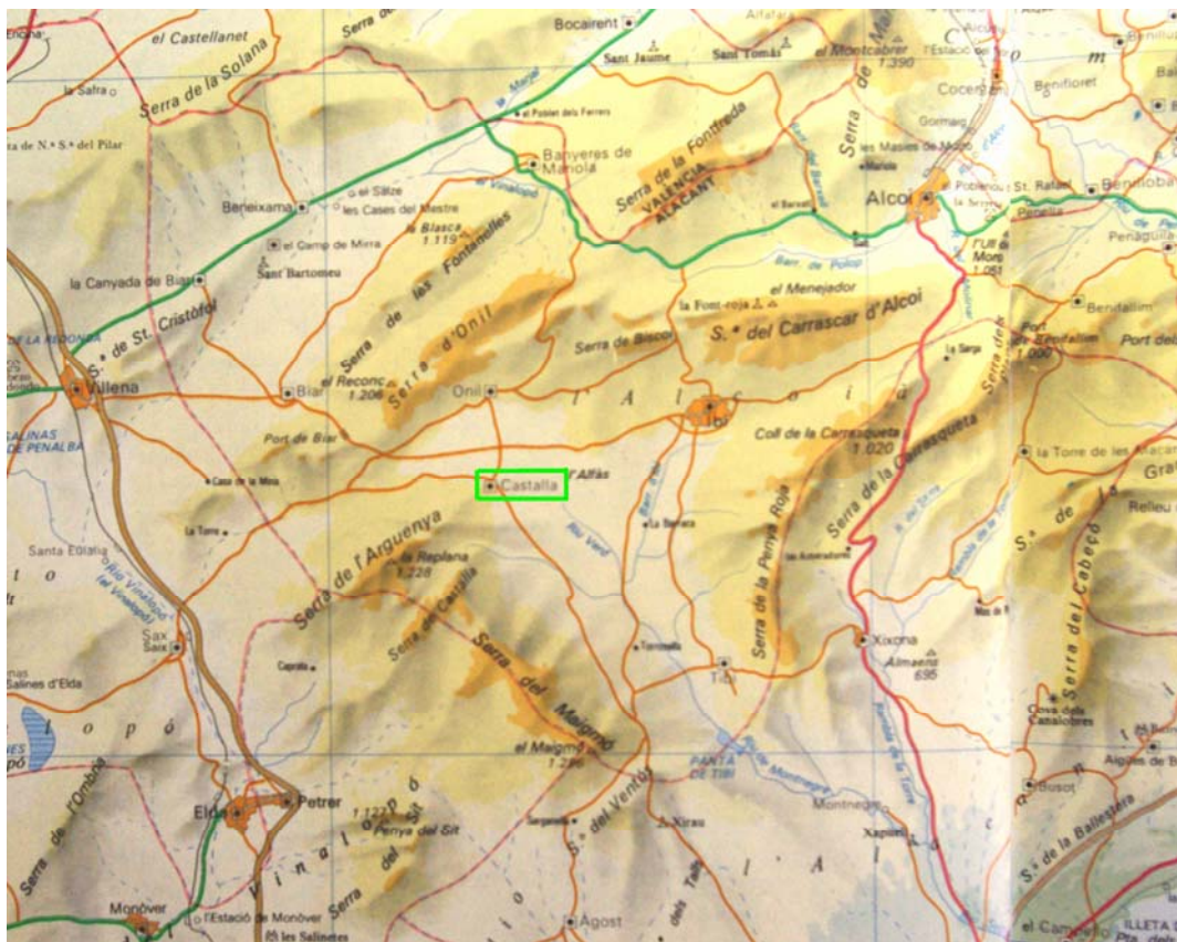
Atles Universal Català. GEC