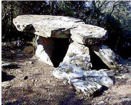
Dolmen dels Tres Peus. Forallac (Baix Empordà)

Saps per què els nostres avantpassats construïen aquestes edificacions?