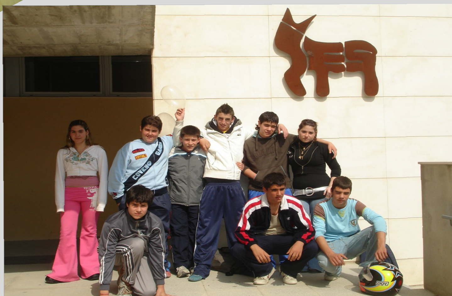
"Els protagonistes de tot: els nostres alumnes"