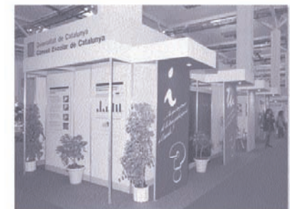
> Saló de l'ensenyament (1994)