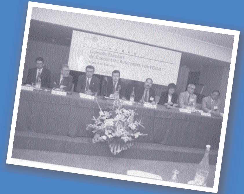
> Jornades de Consells Escolars de Comunitats Autònomes i de l'Estat. Sitges, 1995