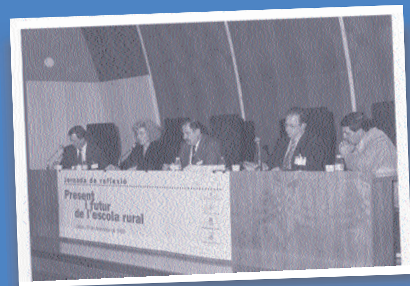
> Jornada: Present i futur de l'escola rural. Lleida, 1995