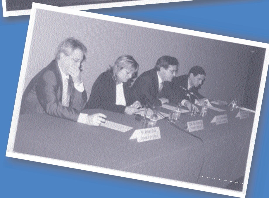
> Jornada: Expressió, cultura i cohesió social. Figueres, 2004