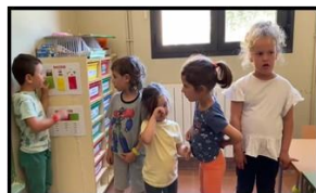
ELS RACONS EI- ESCOLA DOS RIUS

Informar a les famílies i resta de companys de la ZER, mostrant seguretat, sobre alguna activitat/projecte treballat a la seva aula per a què quedin correctament informats i assabentats i que completa l'article escrit de la revista escolar.