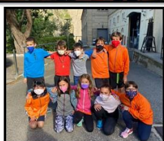
WONDER 4t I 5t- ESCOLA JOAN ROS PORTA