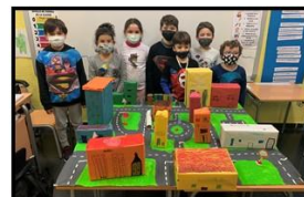
ELS OFICIS EN EL TEMPS DE LA CENTRAL CM- ESCOLA DOS RIUS