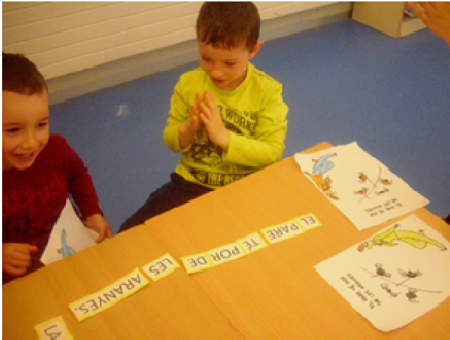
GRUP 2: El pare té por de les aranyes.