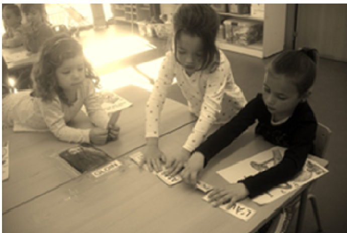
GRUP 5: L'àvia té por...