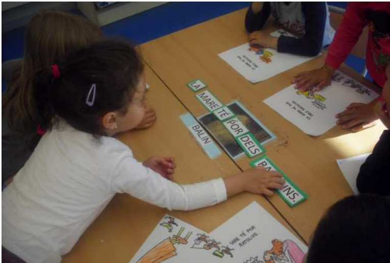
GRUP 4: La mare té por dels ratolins.