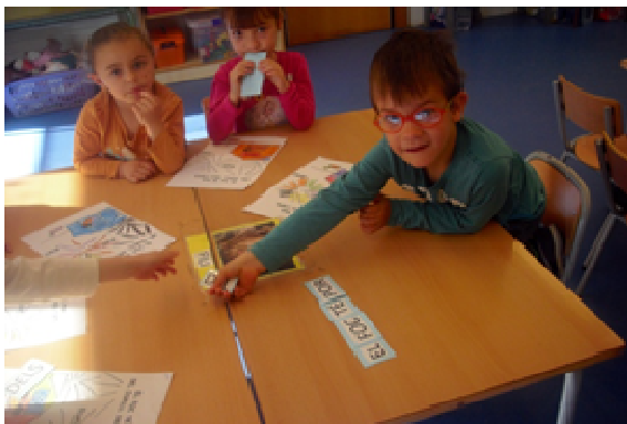
GRUP 1 El foc té por dels coets.