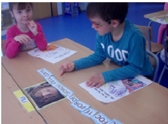
GRUP 1: Ja està!