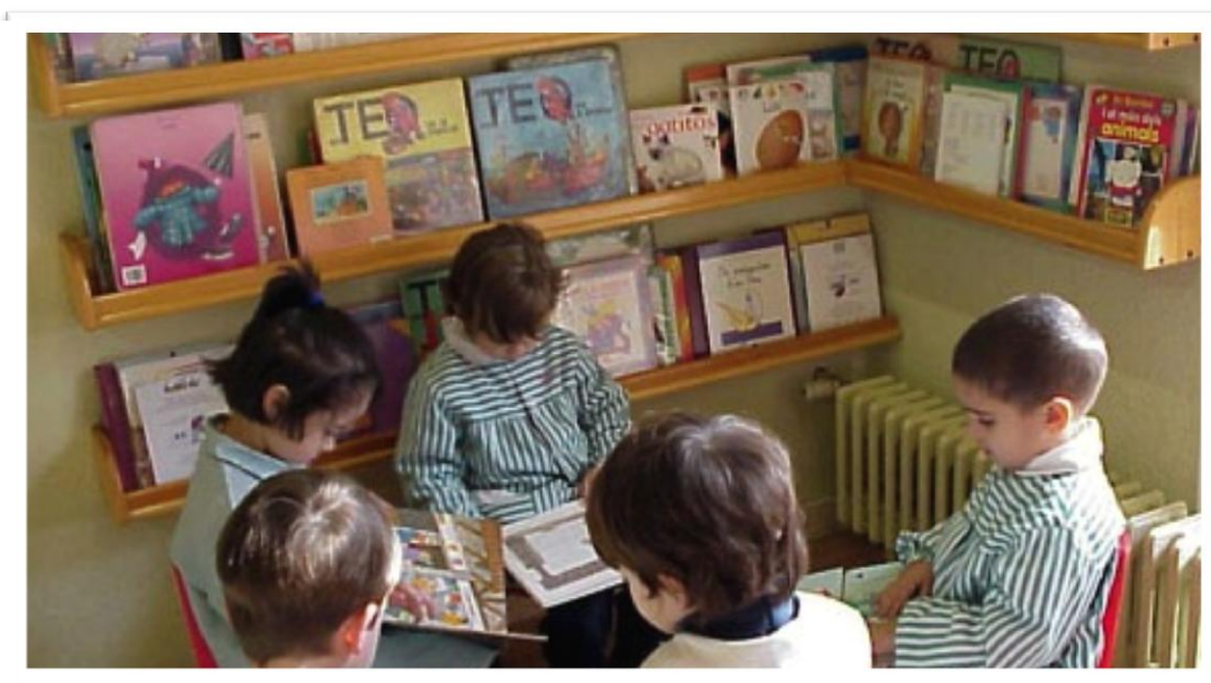
Biblioteca d'aula de l'Escola Casas (Barcelona)