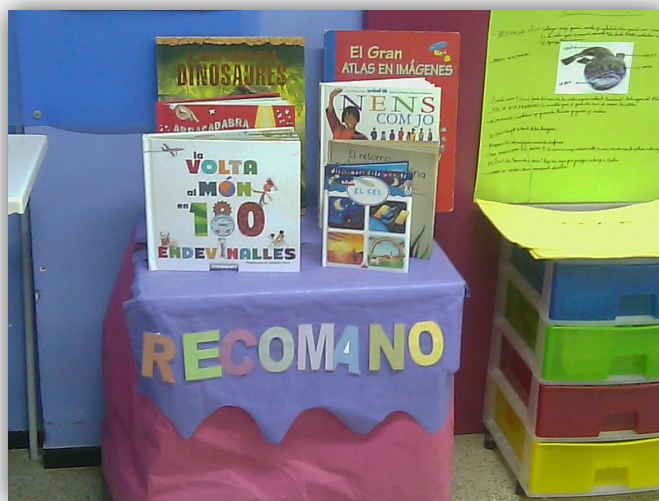
Escola Olga Xirinacs (Tarragona)