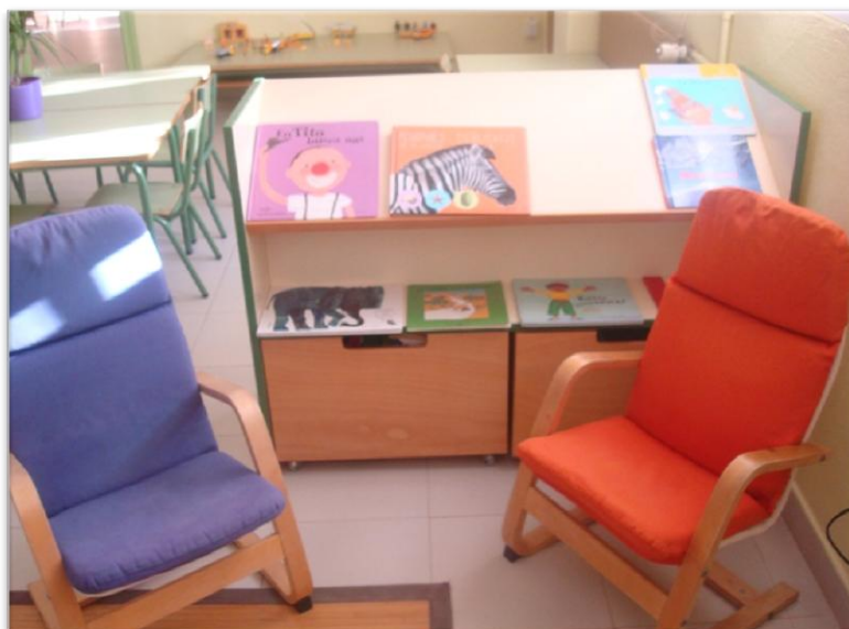
Escola La Llacuna del Poblenou

Hi hauria d'haver també un espai de lectura informal, amb coixins i catifa de foam .