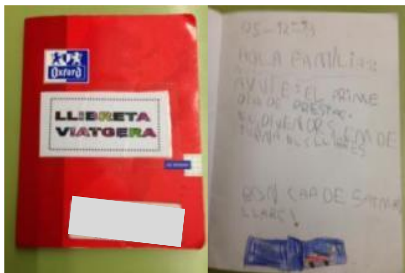
Quadern viatger de l'Escola L'Estel (Barcelona)