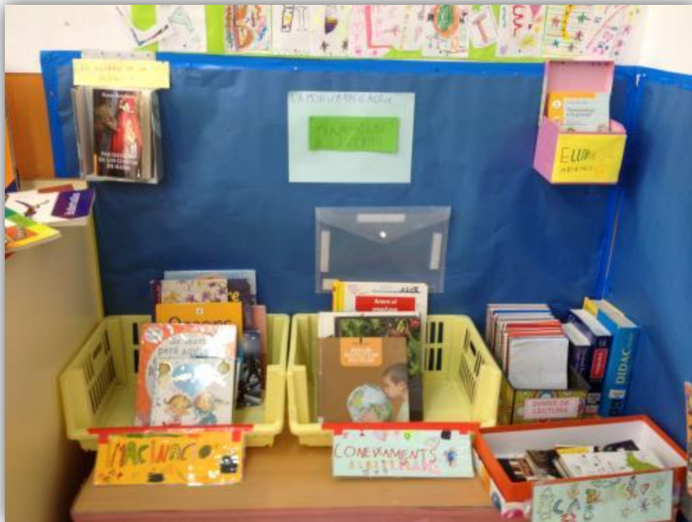
Biblioteques d'aula (Escola Mare de Déu del Remei, Alcover)