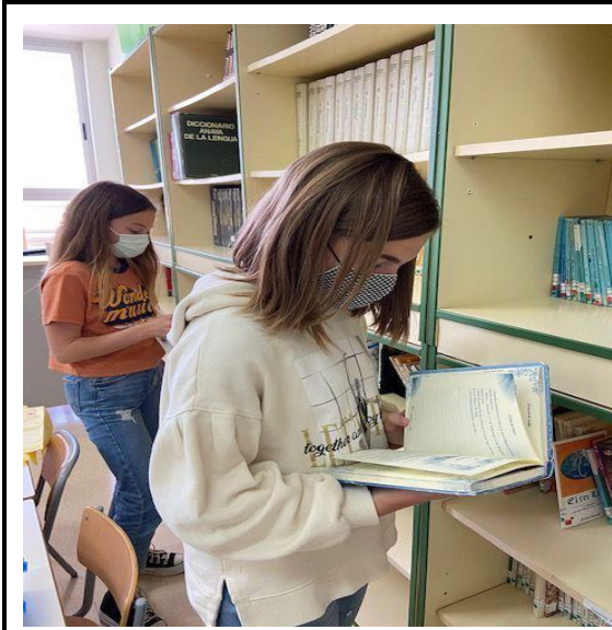
Elecció del llibre/contes/revista de la biblioteca.