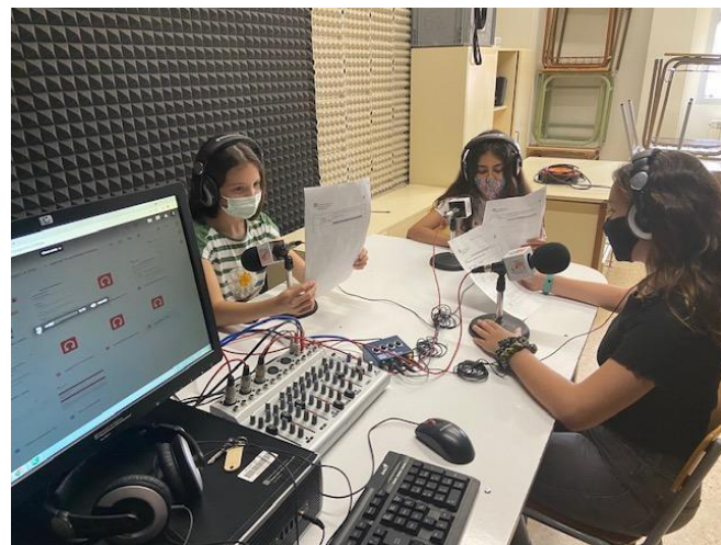
Enregistrem el programa.