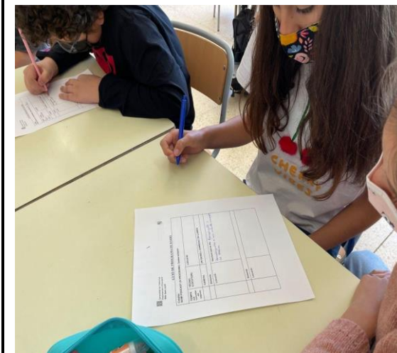
Elaborem al guió radiofònic.