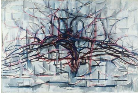
Imatge 1. L'arbre, Piet Mondrian, 1911