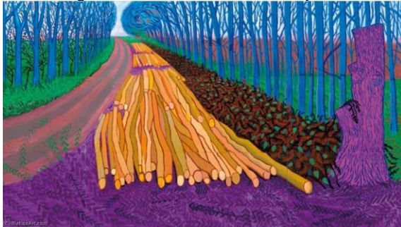
Imatge 3. Arbres tallats, David Hockney, 2005