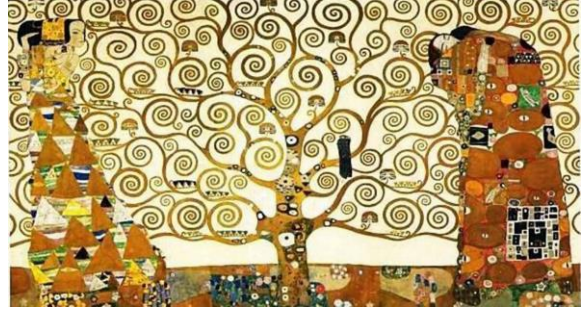
Imatge 2. L'arbre de la vida, Gustav Klimt, 1909