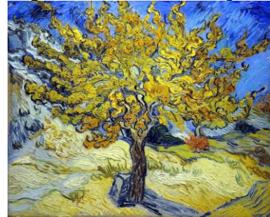
Imatge 4. Morera, Vincent Van Gogh, 1889