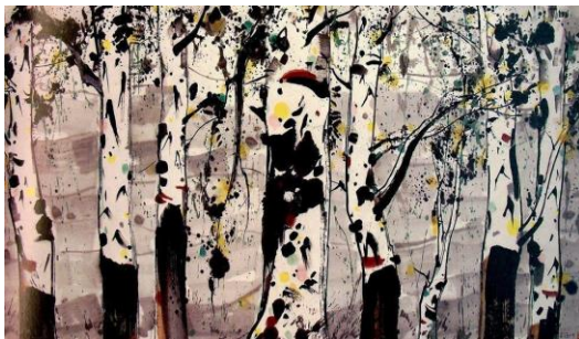
Imatge 5. Bedolls blancs, Wu Guanzhong, 1992