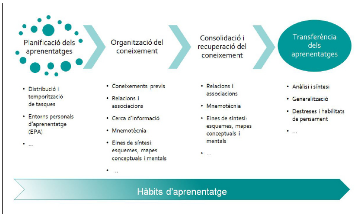
Figura 2. Continguts clau de la competència 2

L'equip docent i els equips de centre que intervenen en el procés d'ensenyament i aprenentatge han de preveure de forma coordinada, en la planificació de curs i dins de cada matèria i projecte, les diferents estratègies i hàbits concretats en les activitats per treballar els continguts clau d'aquesta competència.