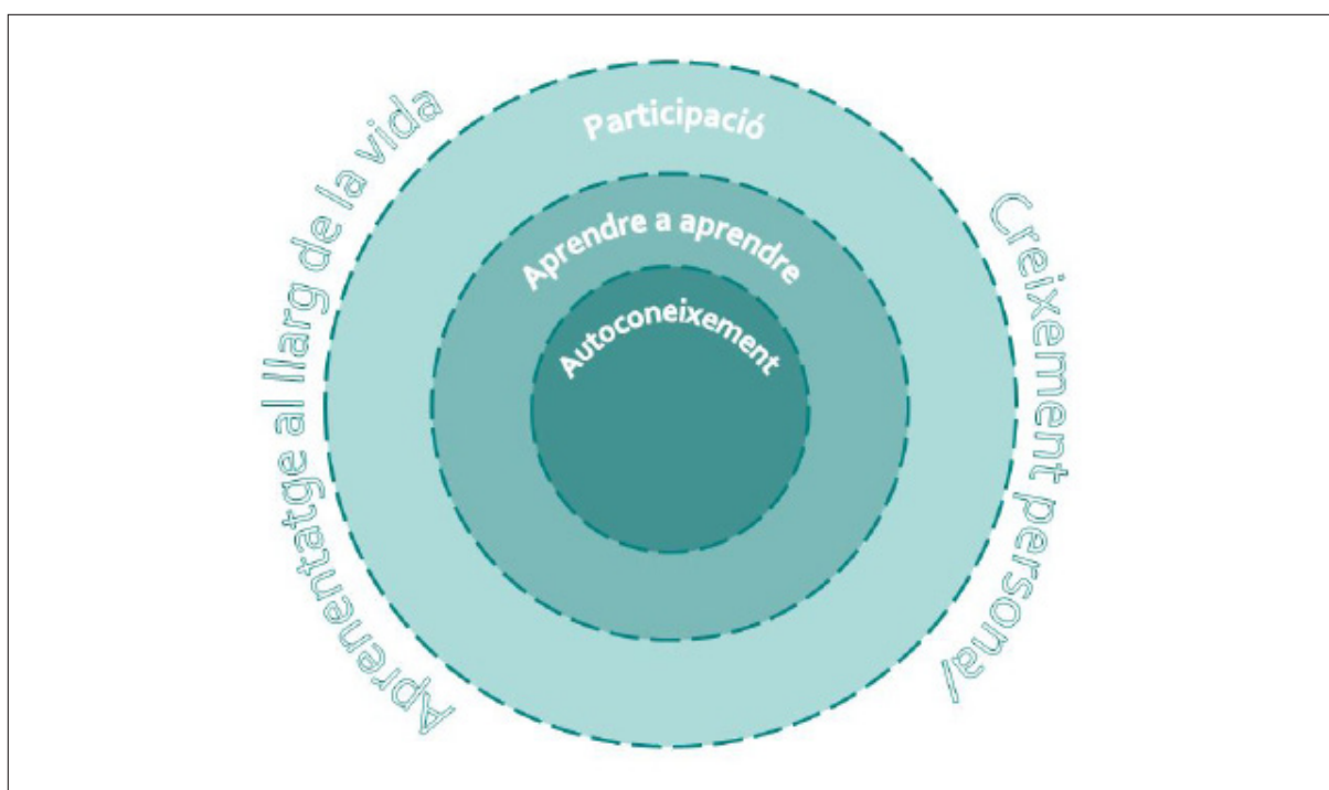
Figura 1. Representació de les relacions entre les dimensions de l'àmbit personal i social

En conclusió, les competències de l'àmbit personal i social que es descriuen en aquest document han de servir per afavorir el creixement global dels alumnes, com a persones i com a aprenents. El treball competencial i els processos d'acompanyament i orientació han de col·laborar en la construcció de l'autonomia i de la identitat personal, social i ciutadana de cada alumne durant l'etapa adolescent, per fomentar el compromís i fer possible que en el futur puguin contribuir a la millora social com a ciutadans de ple dret amb responsabilitats compartides.