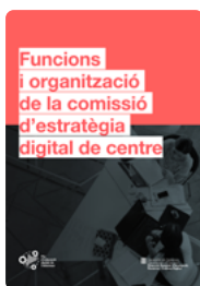
Funcions i organització de la Comissió d'estratègia digital de centre