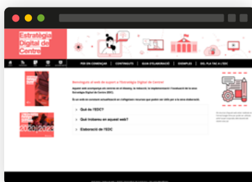
Estratègia Digital de Centre