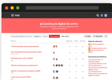
Coordinació digital de centre