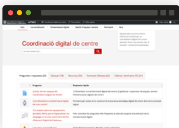
Coordinació digital de centre