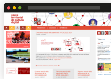
Xarxa Territorial de Cultura Digital