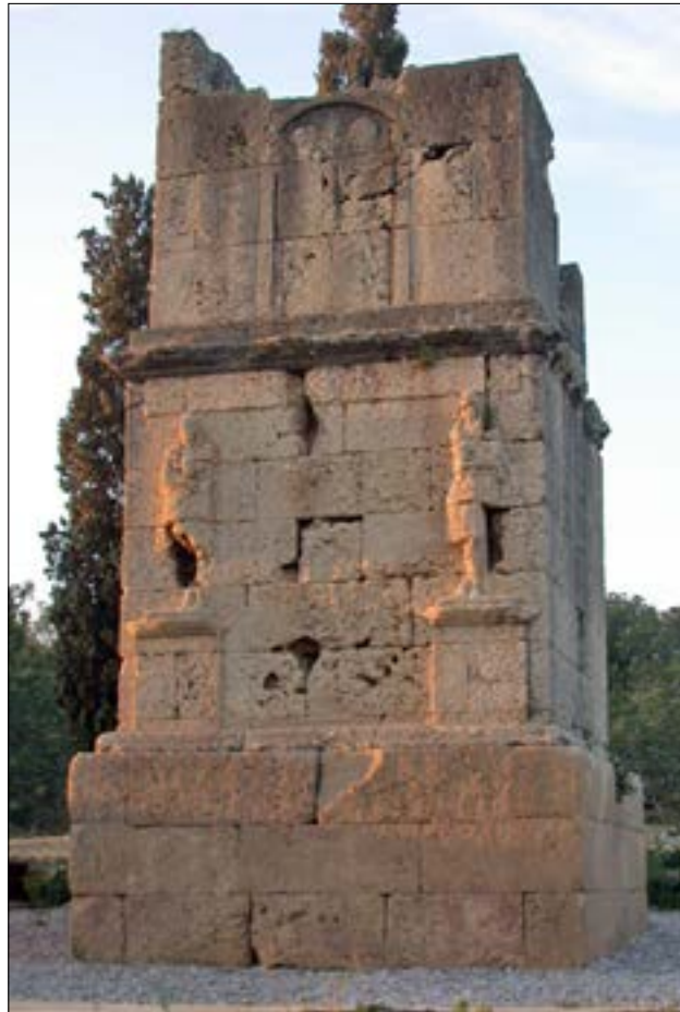
Torre dels Escipions, Tarragona.