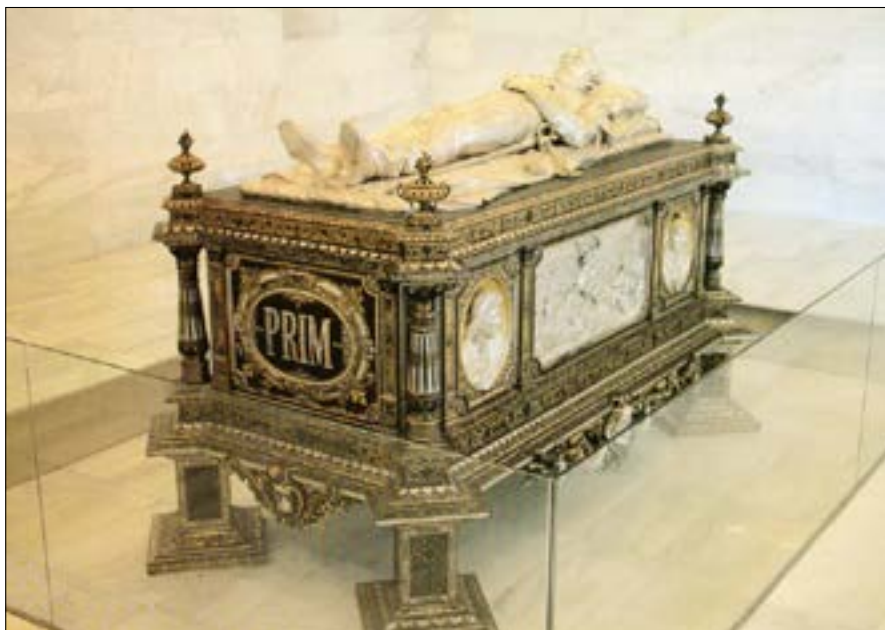
Mausoleu del general Prim, Reus.