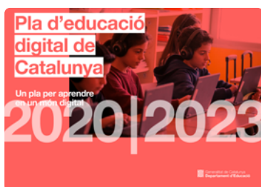
Pla d'Educació Digital de Catalunya (PEDC)

Els documents de referència per determinar els objectius, el funcionament i l'estructura de la comissió d'estratègia digital, són: