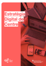
Estratègia Digital de Centre (EDC)