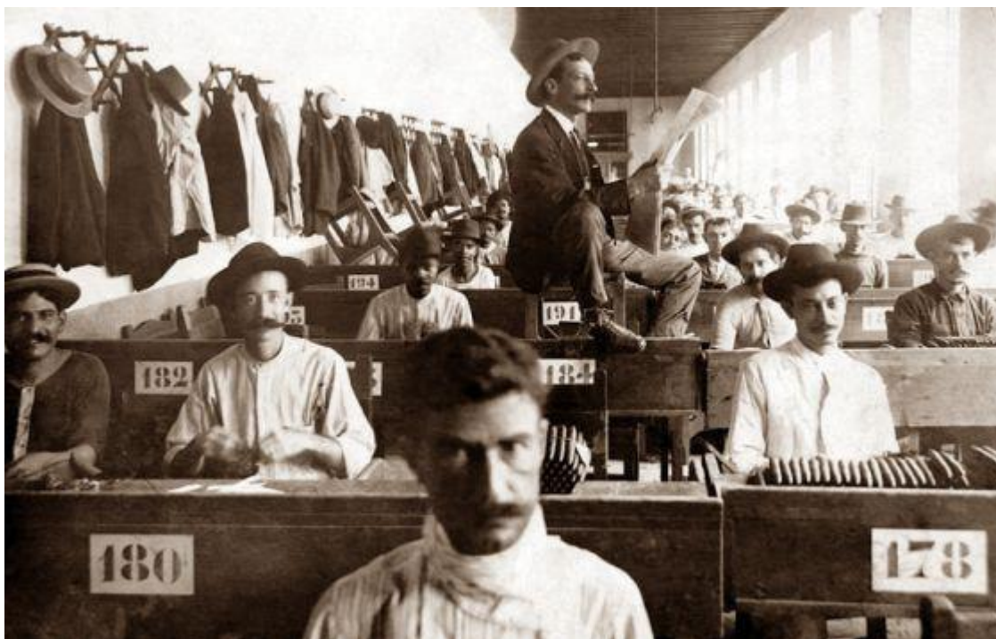
Foto de autor desconocido de un lector de tabaquería en una fábrica cubana de puros de principios del siglo pasado.

Hay muchas cosas que representan la cubanía. Y entre las que más, la trova tradicional y la cultura del tabaco, que además son dos formas de vida. No por casualidad en septiembre Cuba elevó el Son a la categoría de Patrimonio Cultural de la nación. Y ahora ha sido el lector de tabaquería la figura distinguida.