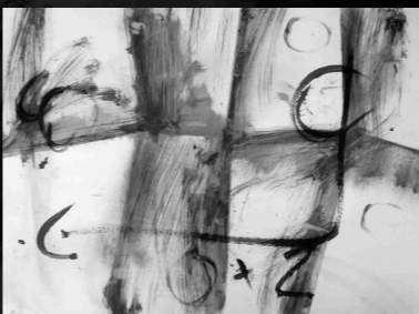
"Cada fracàs ensenya a l'ésser humà quelcom que necessitava aprendre" (Ch. Dickens) Grafit i acrílic sobre paper cuxé 50x70 cm. 2011