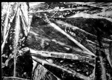
"Va' pensiero sul'ali dorate" Tinta xinesa sobre paper 50x70 cm. 2009