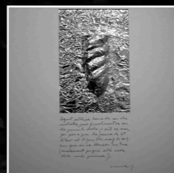
Històries d'entrepans Paper d'alumini i bolígraf sobre cartró 50x50 cm. 2009