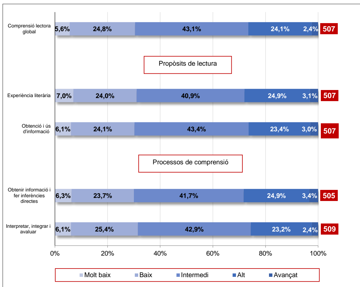
Gràfic 2. Distribució de l'alumnat de Catalunya en els cinc nivells de rendiment de l'escala de comprensió lectora per dimensions avaluades. PIRLS 2021