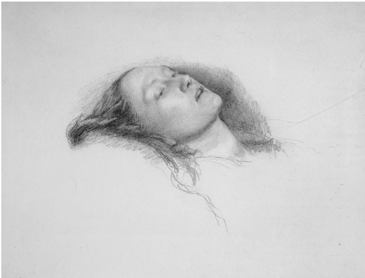
John Everett Millais, Esbós del cap d'Ofèlia, 1852.

Aquest treball de documentació es va complementar amb diferents dibuixos de la model Elizabeth Siddal, per representar la seva Ofèlia .