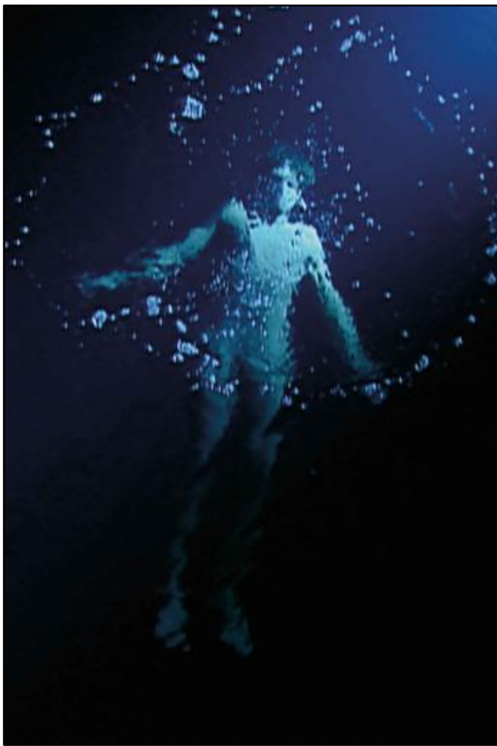
Bill Viola, The Messenger , 1996.

En aquest moviment, la forma del cos es transforma, i en aquesta dissolució es manifesta el seu valor plàstic. Aquest efecte el podem trobar també a les escenes de platja que Sorolla va pintar.