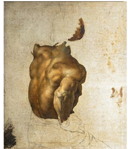
Théodore Géricault. Étude de dos pour Le Radeau de La Méduse (1818-1819). Musée Ingres-Bourdelle