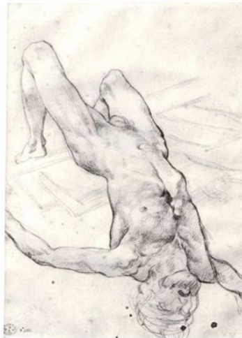
Théodore Géricault. Dibuix preparatori per a El rai de la Medusa (1819). Musée du Louvre