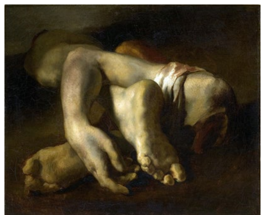
Théodore Géricault, Study of Feet and Hands (1818). Oil on canvas, Fabre Museum