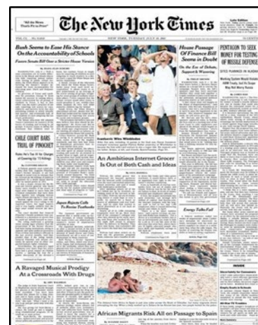
Fotografia de Javier Bauluz per a l'article "A vida o mort. Crònica d'un èxode. La immigració és una tragèdia quotidiana a la costa espanyola", publicada a La Vanguardia (2 de març de 2003) i The New York Times (10 de juliol de 2001)