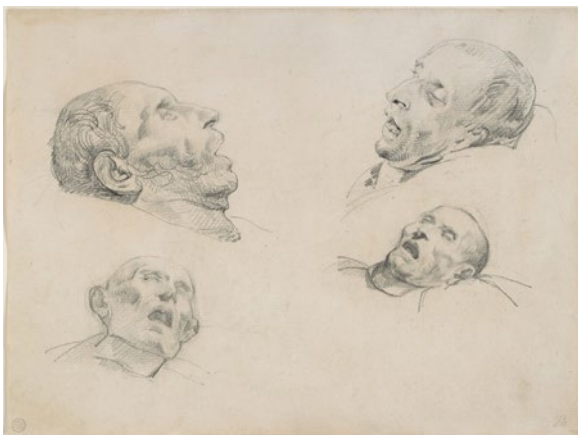
Théodore Géricault, Four Studies of a Severed Head (1818). Drawing. Harvard Art Museums