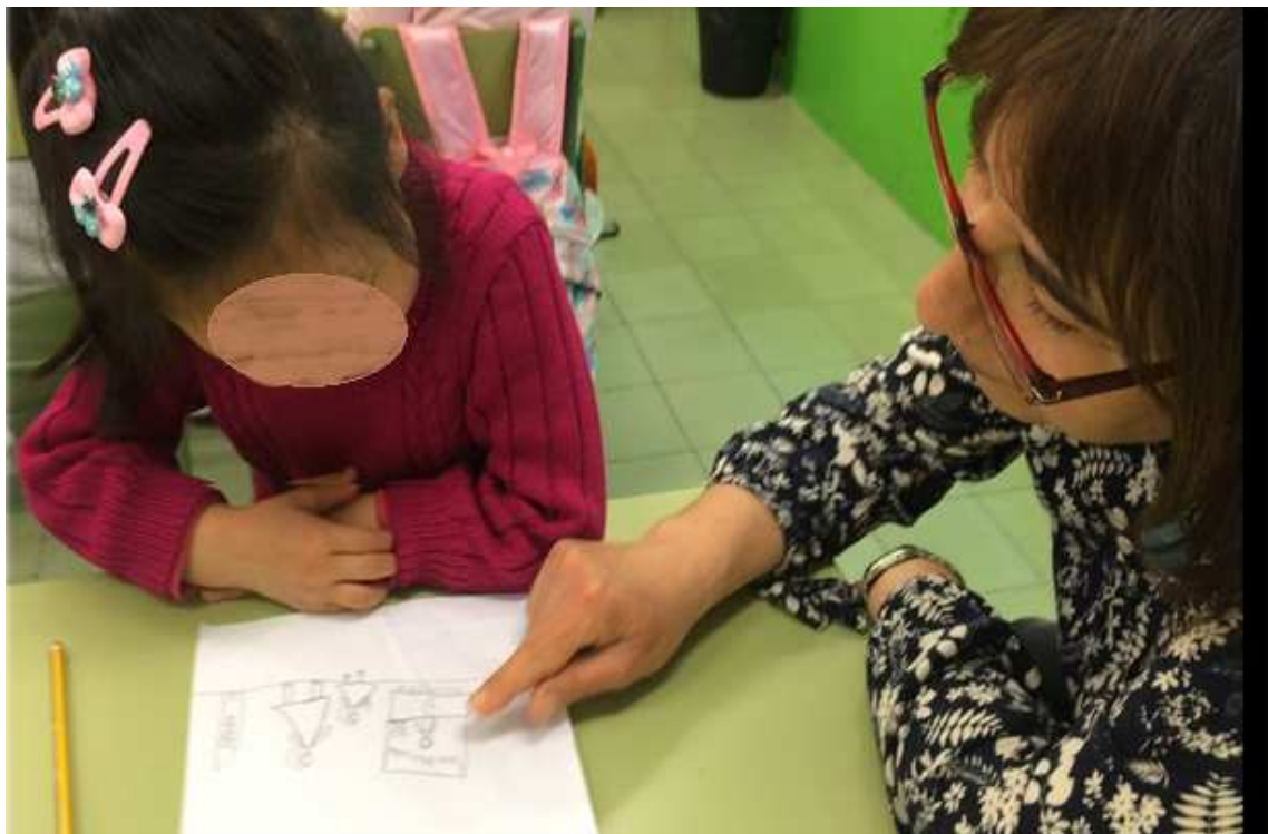
4. Entrevistes d'escriptura de la mestra amb alguns alumnes per atendre el tema del text.