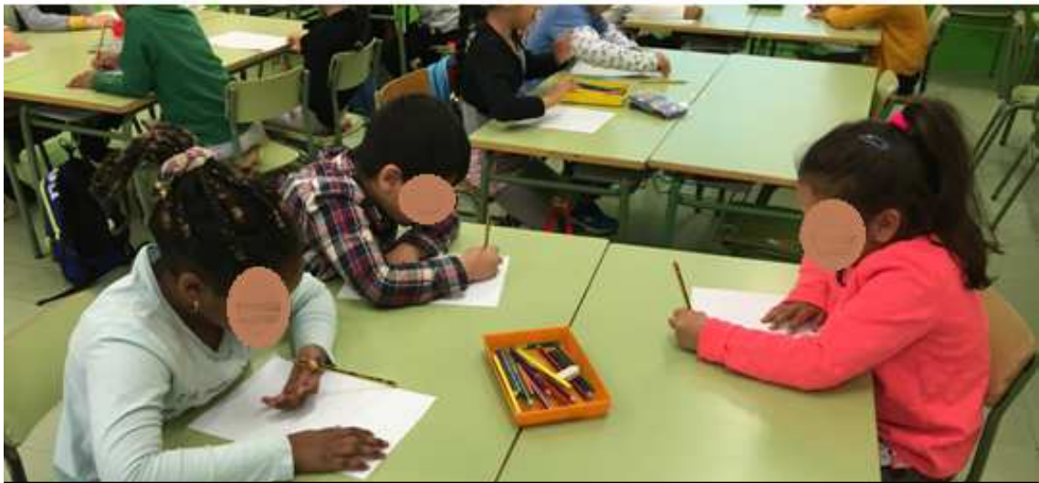
3. Escrivim lliurement sobre el tema triat