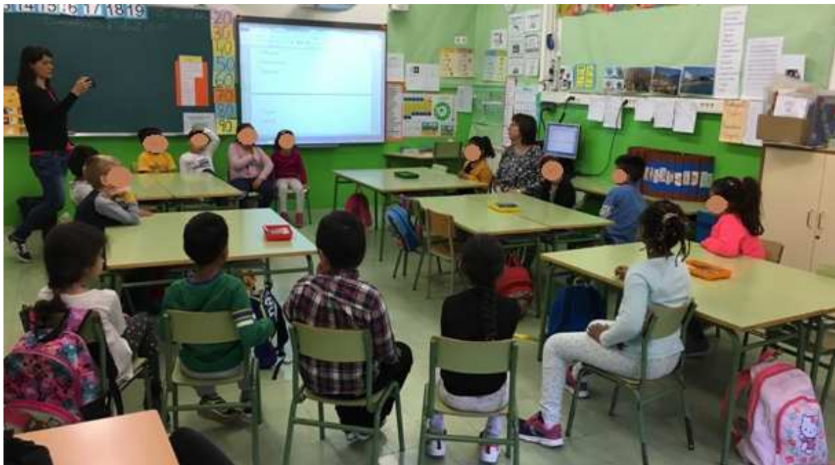
2. Pensem el que podem escriure sobre el tema triat i ho compartim amb els companys.