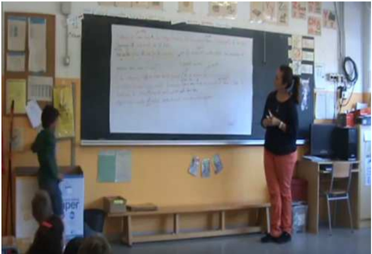
Textualització i revisió