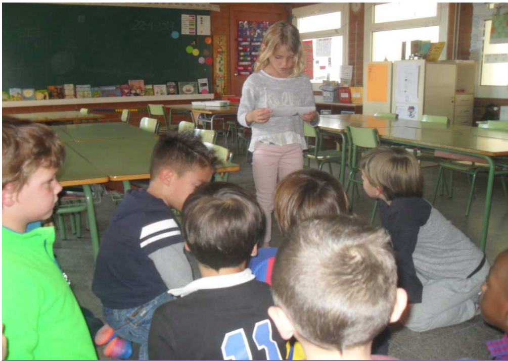
Junts parlem de la màgia dels missatges