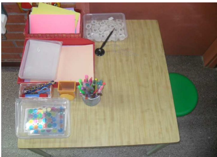
Pensem què podem fer per poder tenir aquesta màgia a la nostra aula