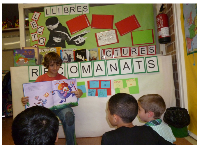
Escola Antoni Bergós- ZER Horta de Lleida