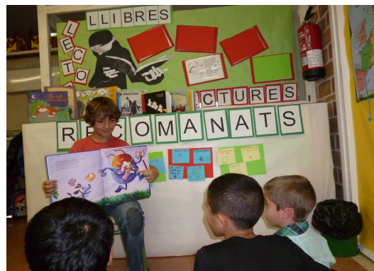
CI- Presentació i recomanació de llibres. Escola Antoni Bergós- ZER Horta de Lleida

S'organitza la presentació dels llibres llegits pels alumnes a partir d' un torn de presentacions.