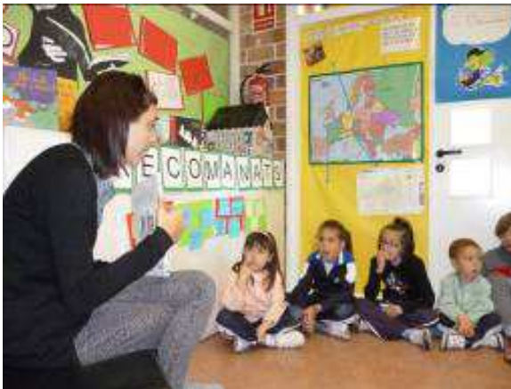
Escola Antoni Bergós- ZER Horta de Lleida.

El mestre farà la presentació del llibre seguint el guió establert, emfasitzant els exponents que els alumnes han de verbalitzar en la seva presentació.