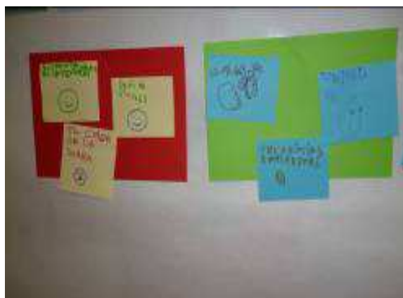
Espai de llibres recomanats