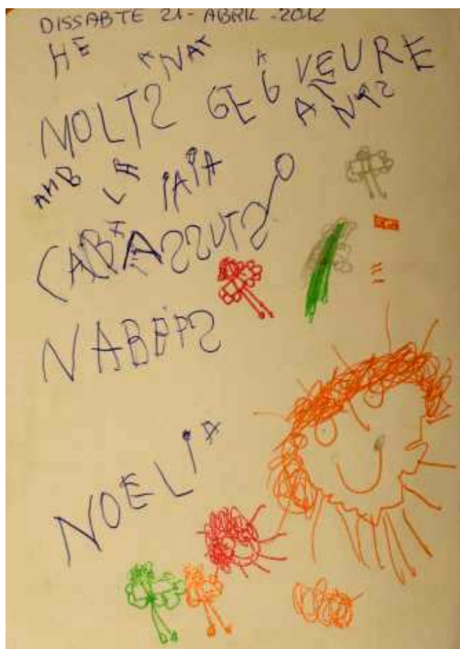
Nota escrita per l'infant.