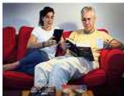
Que ens vegin llegir