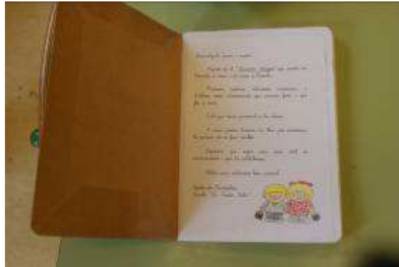
Recomanacions a la família a la primera pàgina del Quadern Viatger.