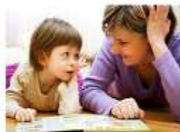
Llegim amb i per als fills