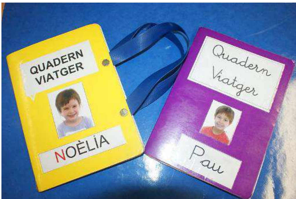
Quadern viatger de P3-P4 i Quadern viatger de P5. Escola Fortià Solà (Torrelló)

QUADERN VIATGER ESCOLA FORTIÀ SOLÀ (TORELLÓ) NIVELLS: EDUCACIÓ INFANTIL