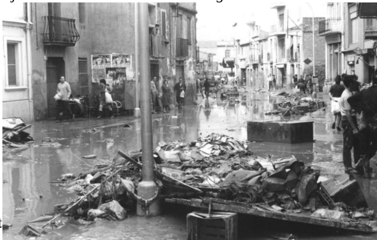
Carrers de Cornellà després de la riuada del 1971.

instal·lats nous barracons per acollir els damnificats, els quals posteriorment serien situats en els habitatges que van constituir el nucli originari de l'actual barri Fontsanta. El llarg retard en l'inici de la canalització del riu comportaria continus enfrontaments entre l'Ajuntament i els habitants de les zones afectades, problemàtica agreujada per l'augment de les pressions exercides per una població