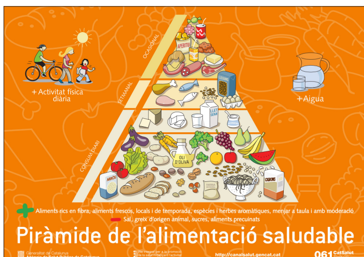
Figura 1. Piràmide de l'alimentació saludable Agència de Salut Pública de Catalunya. Generalitat de Catalunya

Tal com es veu a la figura 1, les característiques d'una bona alimentació responen a les proporcions i tipologies d'ingestes que es mostren a la piràmide de l'alimentació saludable.