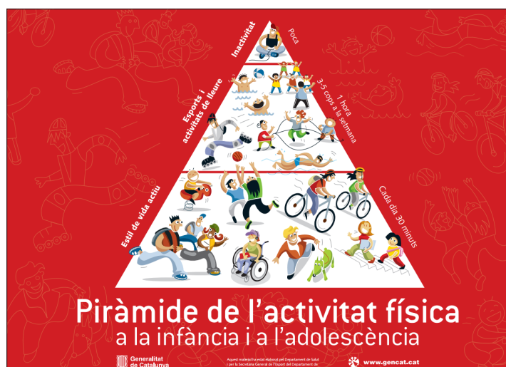
Figura 2. Piràmide de l'activitat física Departament de Salut. Secretaria General de l'Esport. Generalitat de Catalunya

Tal com es veu a la figura 2, les característiques d'una pràctica d'activitat física saludable responen a la tipologia i freqüència del temps de pràctica que es mostra a la piràmide de l'activitat física.