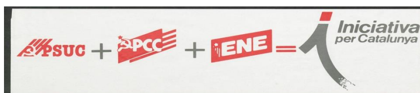
Imatge que mostra la transformació del PSUC, PCC i ENE en Iniciativa per Catalunya

Com a marxista i militant a Comissions Obreres, esdevé militant d'Iniciativa per Catalunya. Això és degut a que el PSUC (Partit Socialista Unificat de Catalunya) i el PCC (Partit de Comunistes de Catalunya) i l'Entesa dels Nacionalistes d'Esquerra s'agrupen en aquesta nova federació.