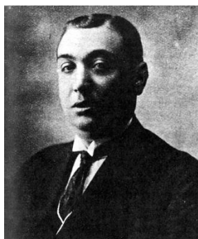
Salvador Seguí (“Noi del Sucre”)

Fruit dels seus estudis a la Universitat de Deusto és la tesi “El sindicalismo cristiano en España”, preparada entre els anys 1955 i 1958. Per a la seva elaboració es trasllada a Tolosa de Llenguadoc, a França. Allà entra en contacte amb dirigents del PSOE i de la UGT que estaven en l'exili per culpa de la dictadura franquista (Pascual Tomàs, Rodolfo Llopis i José Barreiro). També es troba amb militants de la CNT, com la vídua de Salvador Seguí 2 també conegut com “El Noi de Sucre”, una de les persones més destacades de l'anarcosindicalisme català a principis del segle XX.