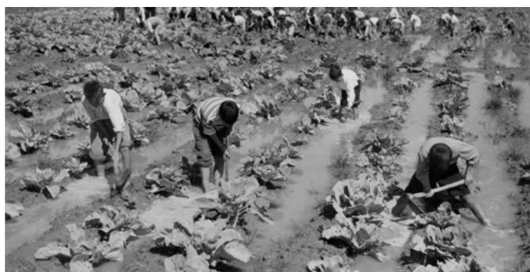
Treballadors que formaven part del "Plan Badajoz"