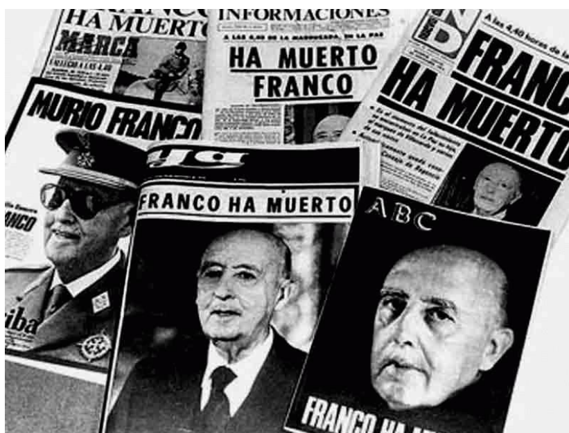
Premsa del 20 de novembre de l'any 1975. Dia en el que mor Franco i comença la transició