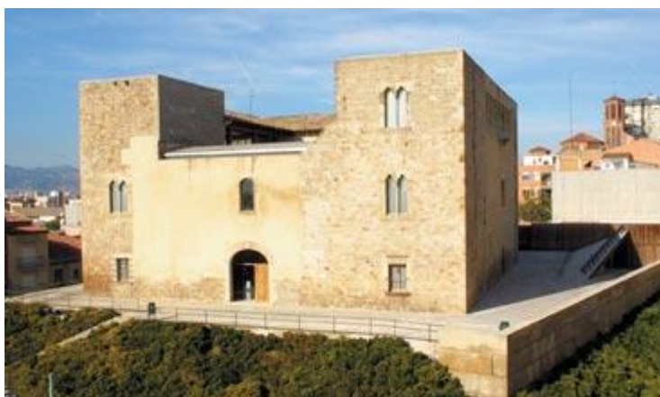
Castell de Cornellà, actual emplaçament de la Fundació Utopia

El naixement de la seva fundació va ser un testimoniatge, no a la seva història, sinó a la història col·lectiva (tal com diu en el seu homenatge) d'una gent d'un moment determinat, i sobre tot una referència moral, simbòlica que costa molt de mantenir. La fundació és un homenatge a ell però sobretot a totes aquelles persones que van lluitar pel canvi democràtic, la transformació social, que no es van resignar a una realitat negativa, sinó que van lluitar per transformar-la.