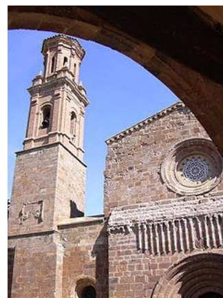
Monestir de Nuestra Señora de Veruela, prop de Saragossa