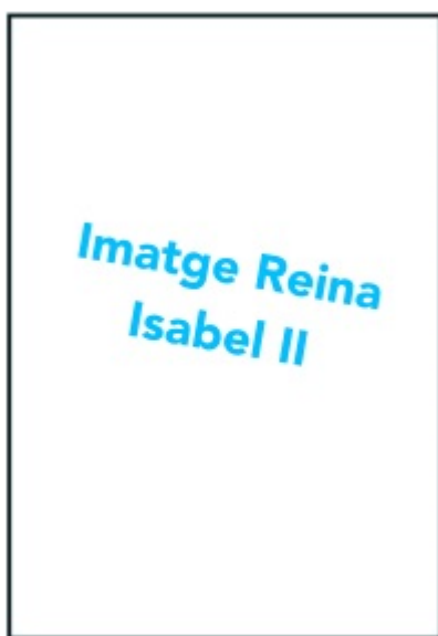
Reina Isabel II