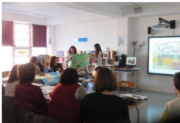
Seminari de BE de la Ribera d'Ebre