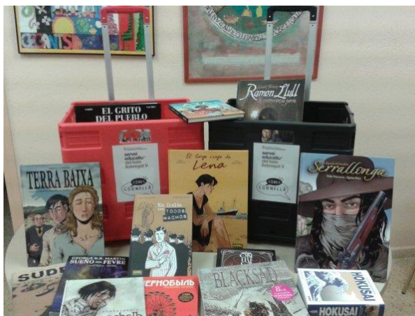
Maleta de còmics , CRP Baix Llobregat V