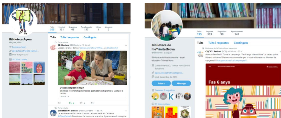
Twitter de l'escola Àgora i de l'Institut Escola Trinitat Nova, ambdues participants del seminari de biblioteques escolars de Nou Barris.