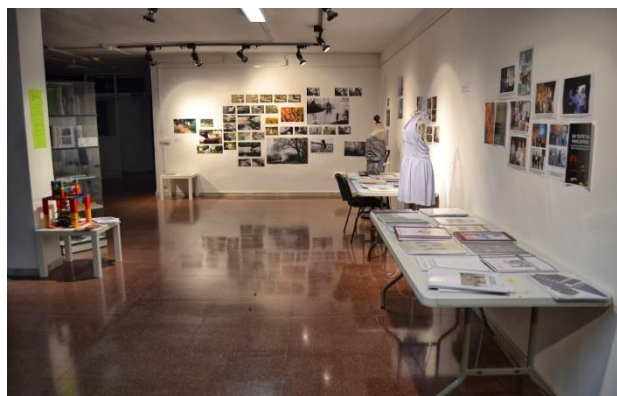
Exposició de treballs de recerca de Batxillerat Institut Antoni de Martí i Franquès (Tarragona)