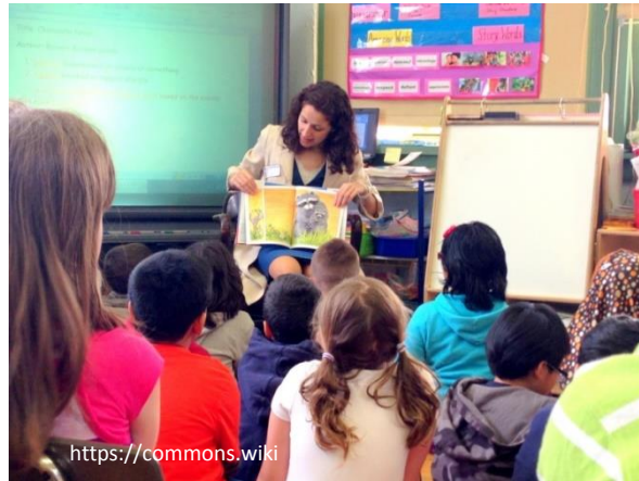
Escola Prat de la Riba (Reus)