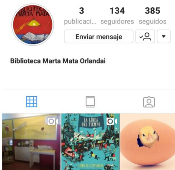
Compte d'Instagram de la biblioteca Marta Mata de l'escola Orlandai.