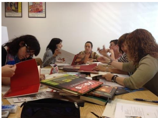
Seminari de BE de l'Alt Camp