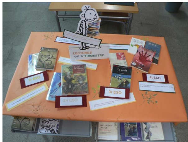
Institut La Roca (La Roca del Vallès)