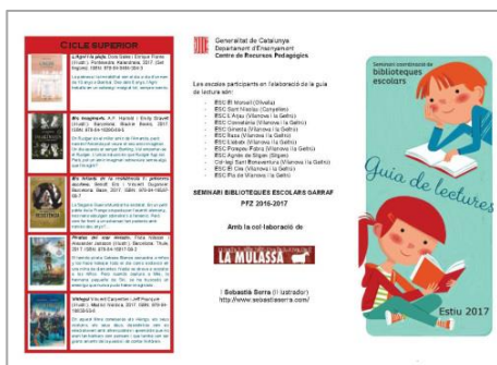
Seminari de biblioteques escolars del Garrafr